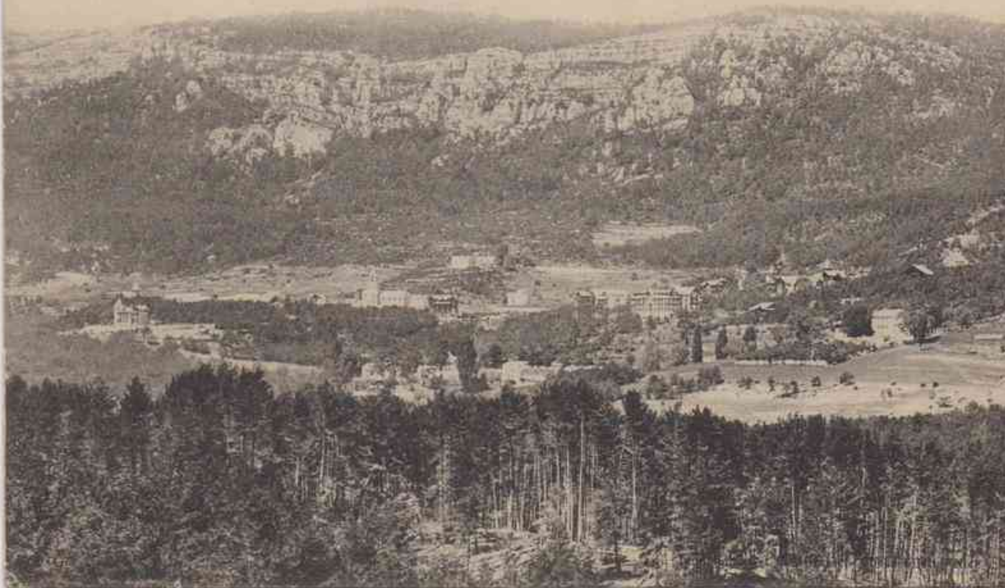
Station Alpestre de Thorenc (A.-M.), altitude 1250 m. - Vue générale