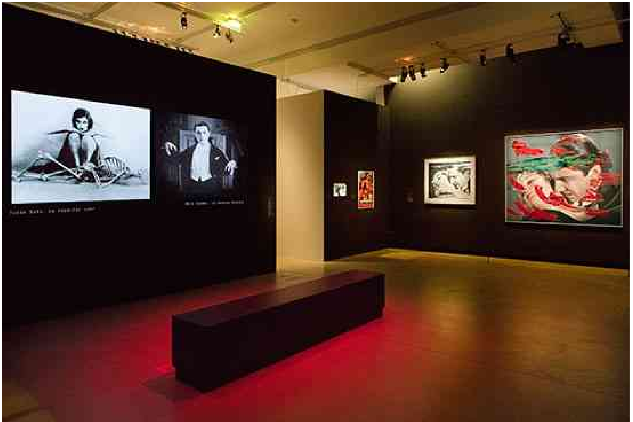
Fichier issu d'une page EMAN : http://eman-archives.org/CinEx/items/show/270?context=pdf