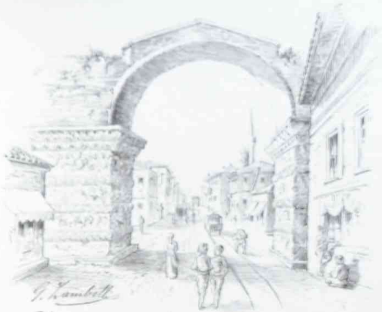
V. Lamberti Arc de triomphe de Constantin