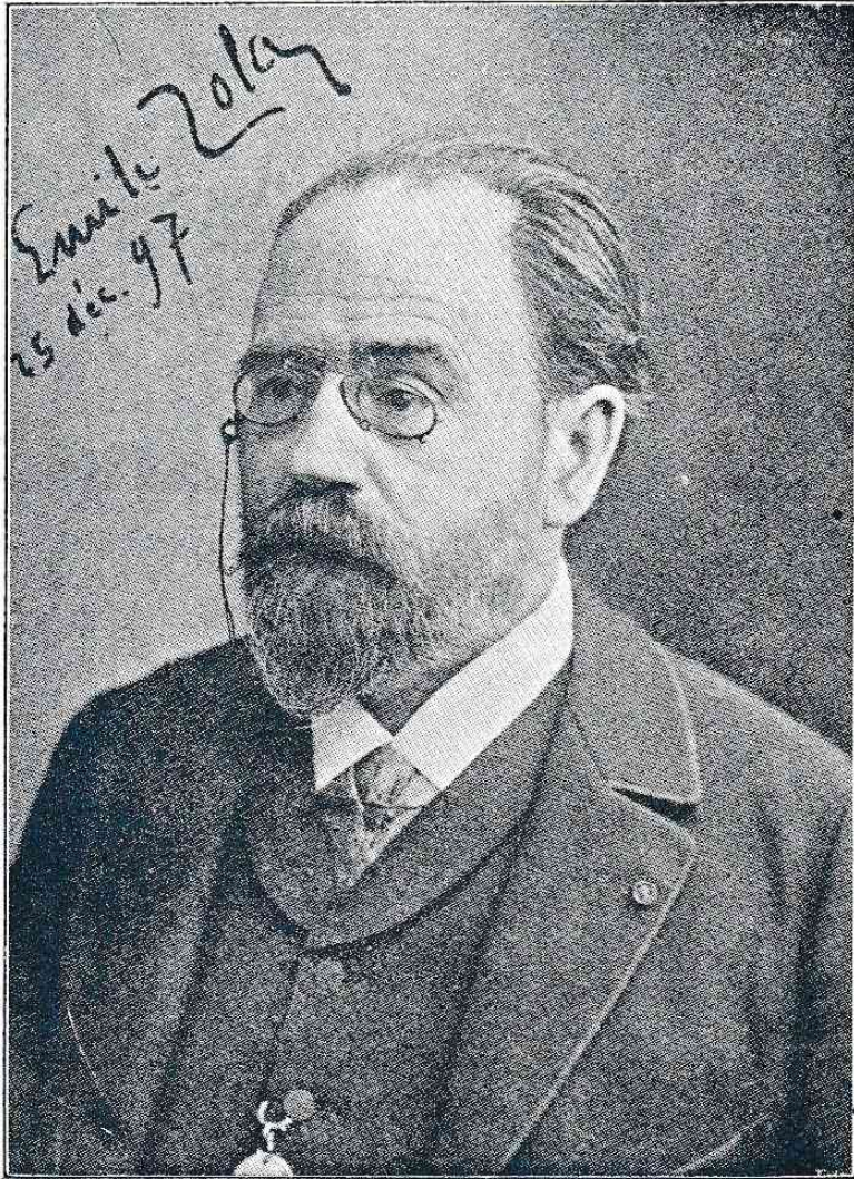
Emile Zola امیل زولا

حضرات اقدیم من محکمی سزای محاکمه ابریکه ، زینانک لهد طرفه و با خصوصیه هیج الهیت ویر لمانه عمما نهد آره نده کی طرفه راه حفا نیت و حجان آن نیت ده سه محکمی سزای محاکمه ابریکه ری . محکمه : اوقار عامه ده صدرا اوله اعلام من محکمه نهد اعلام عدلکنا سزای کی قابل تمجید و صبح و کلمه آنک ملکی حکم ادریح ولایتیغیرده . بیونم صدای کلمه