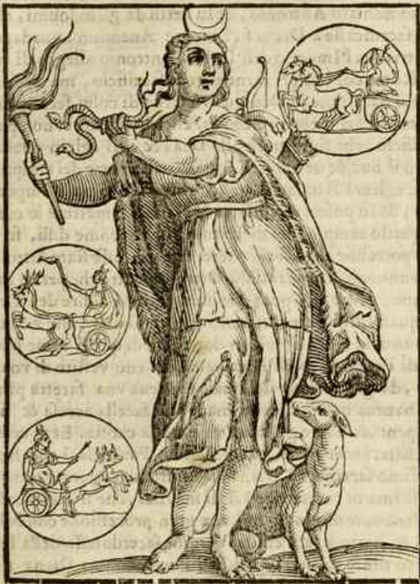
Imagene di Diana dea della caccia, & de boschi, & amatrice de Cerui à lei sacrati, che dinotano il presto suo corso in 29. giorni, & esser la illuminatrice della notte essendo tolta per la Luna, & scorta de viandanti nella notte.