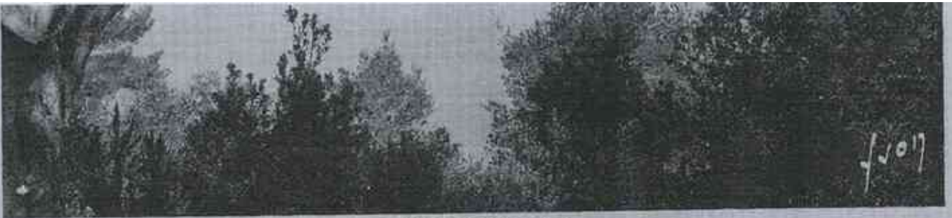
ILE DE PORT-CROS (Var)