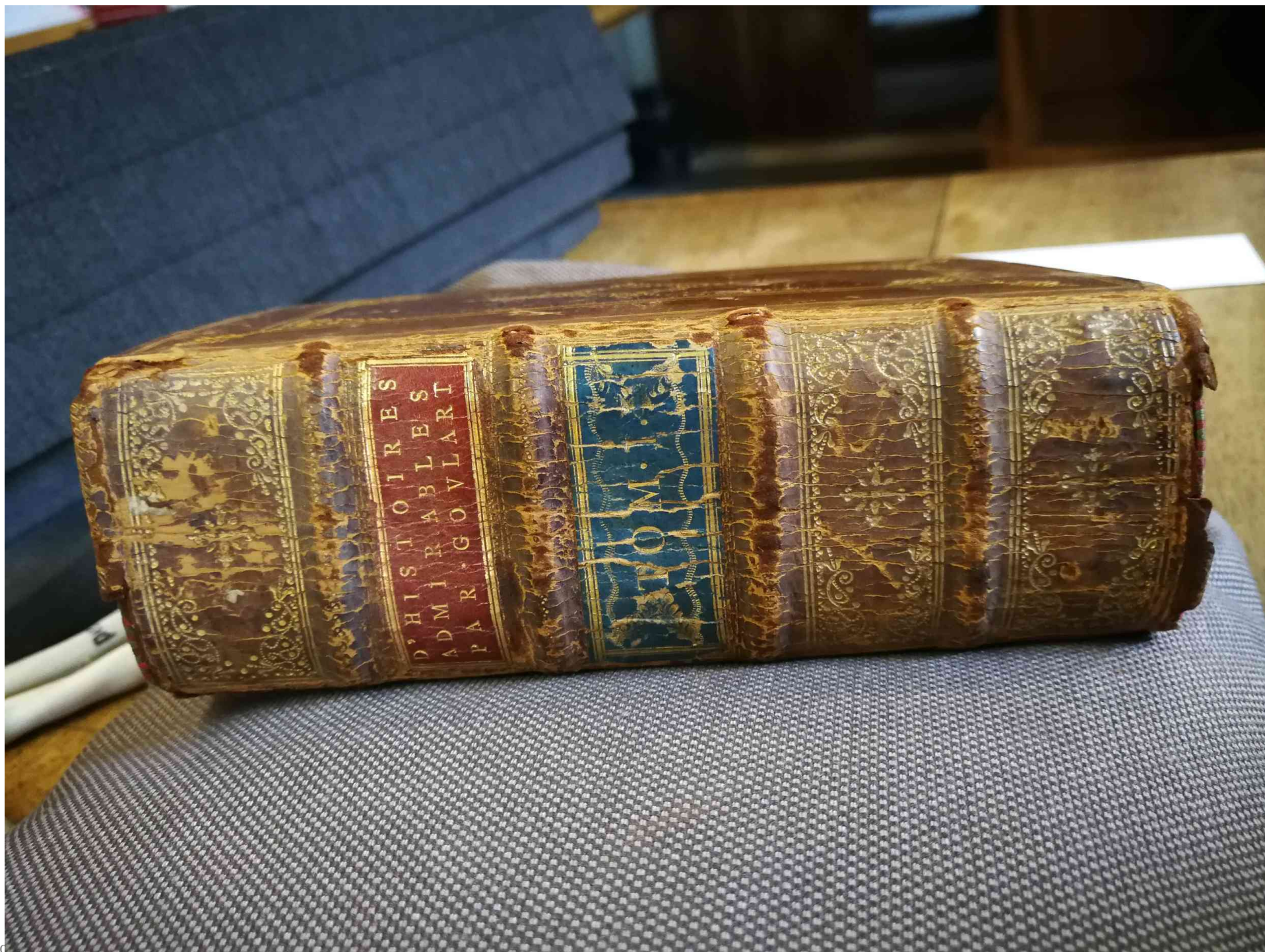
Fig. 1. Spine of the book.