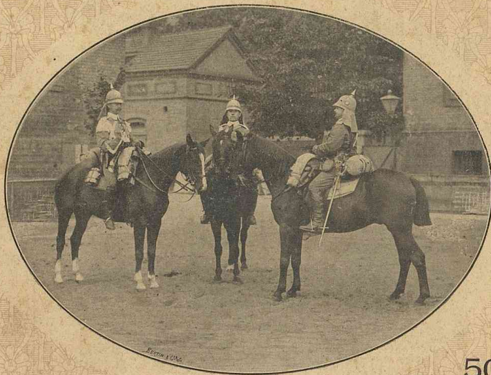
LE VOYAGE DE GUILLAUME II : LES TROMPETTES DE L'ESCORTE.