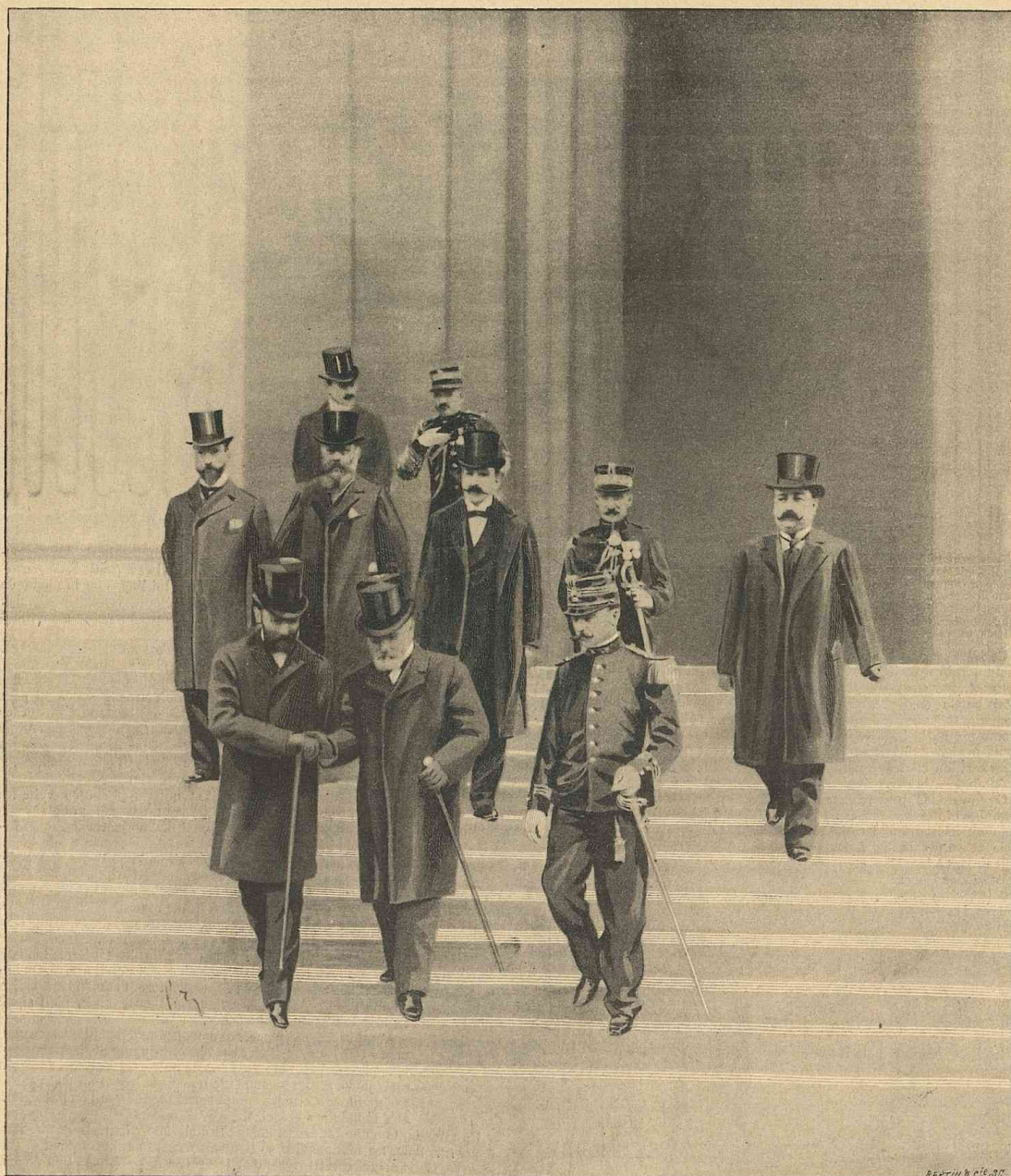
M. LOUBET ET LES FILS DU PRÉSIDENT CARNOT SORTANT DU PANTHÉON (24 juin 1899 — Cinquième anniversaire de l'assassinat du Président Carnot.)