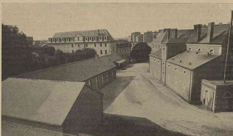
Cour séparant la manutention de la prison (--- chemin que suivra Dreyfus de la prison au Conseil de Guerre).