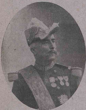
M. LE GÉNÉRAL GALLIFFET. Ministre de la Guerre.