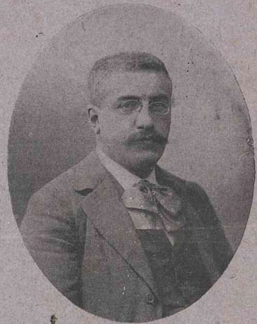
M. MILLERAND Ministre du Commerce.