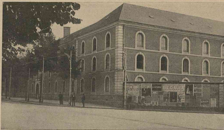
Façade et entrée de la manutention à Rennes.