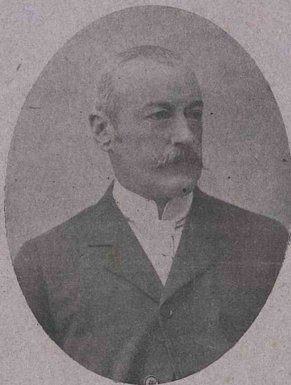
M. WALDECK-ROUSSEAU Président du Conseil, Ministre de l'Intérieur.