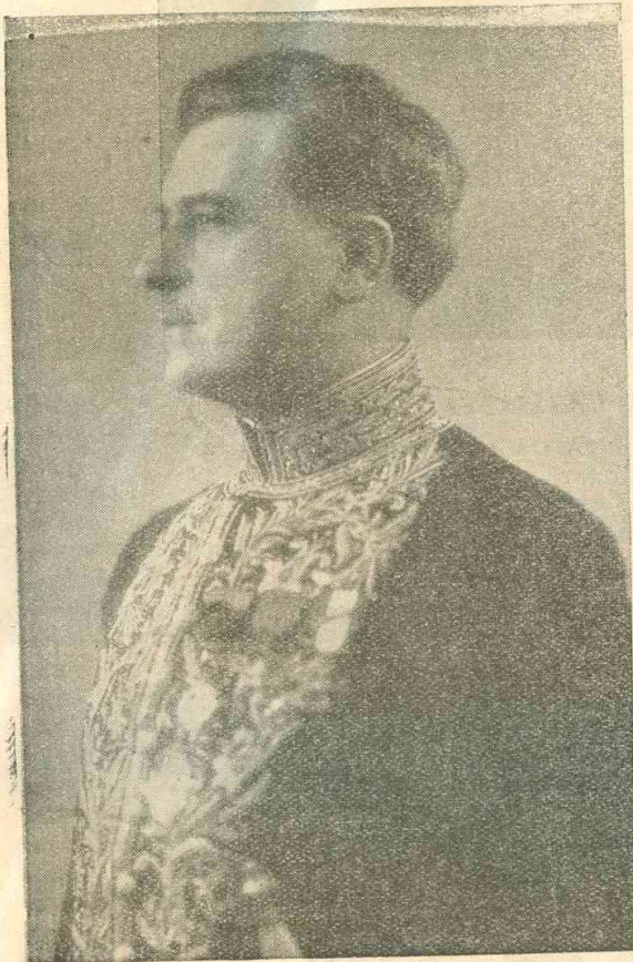
MONSIEUR LE GOUVERNEUR GÉNÉRAL CAYLA

Commandeur de la Légion d'Honneur izay namorona ny Salon de Madagascar ary hotsarovana lalandava eo amin' ny