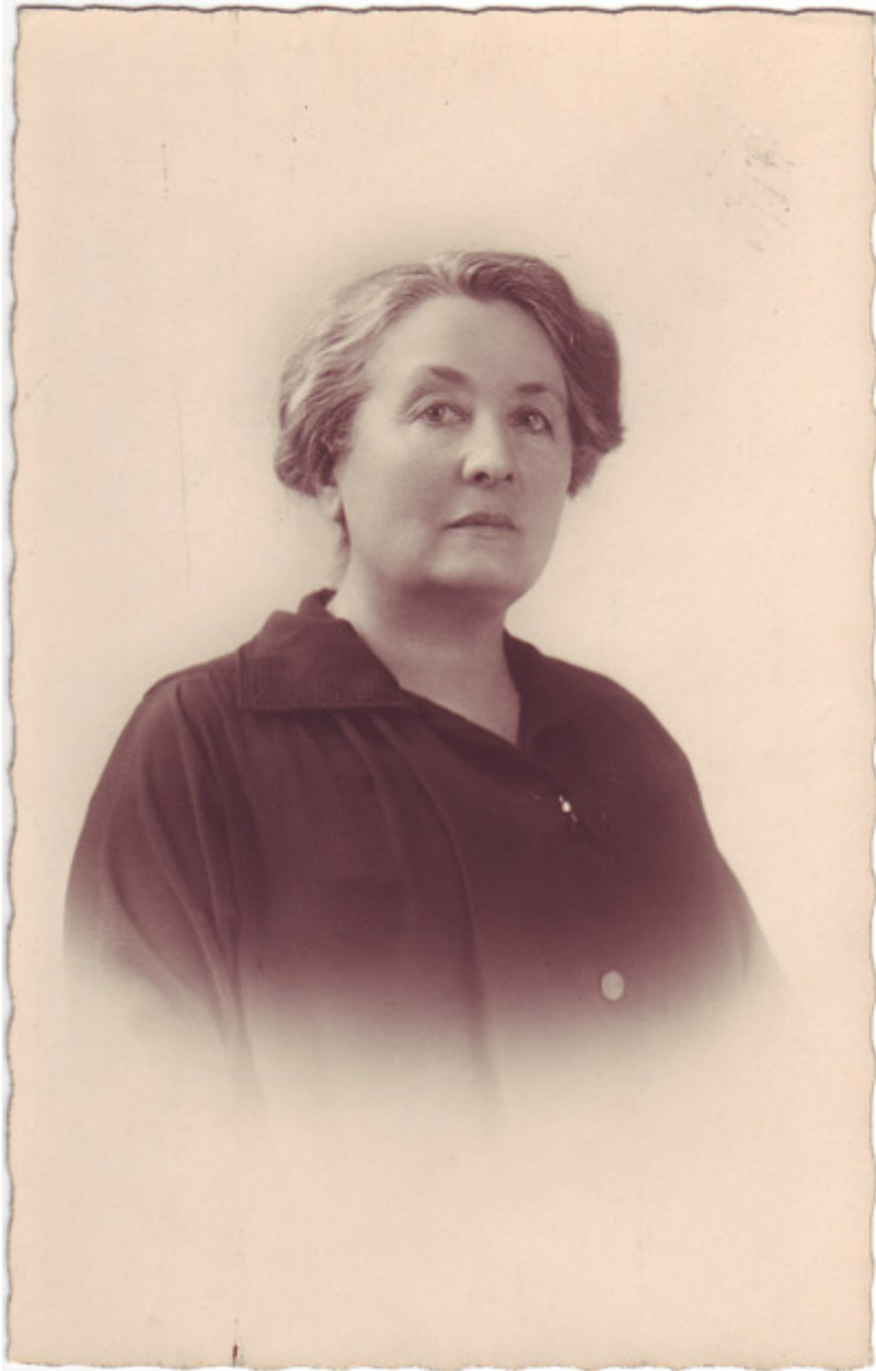
Carte postale de Marguerite Audoux à Alain-Fournier Audoux, Marguerite