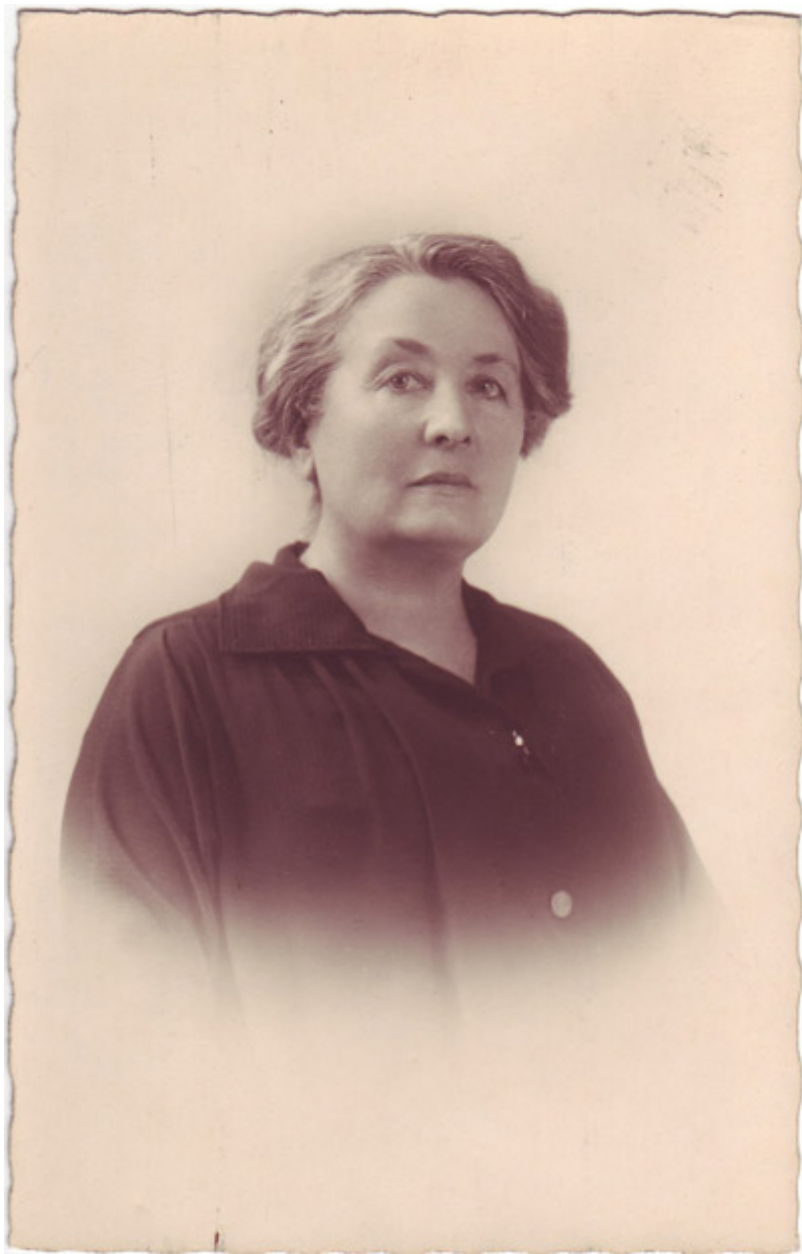
Carte de visite de Marguerite Audoux à Alain-Fournier Audoux, Marguerite