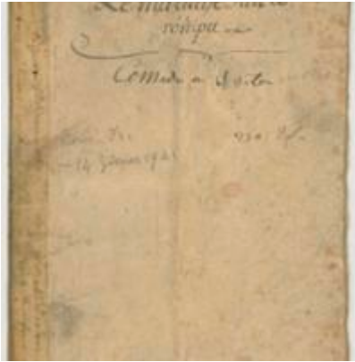
Mariage fait et rompu (Le), comédie en trois actes et en vers Du Fresny, Charles (1648-1724)