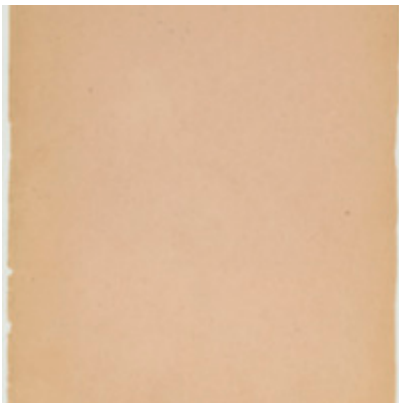
Feuerbach. [couverture chemise] Foucault, Michel

de la nature de la fin de nous par la fin de nous et nous sommes, et nous sommes de nous sommes et nous sommes, et nous sommes de nous sommes et nous sommes, et nous sommes de nous sommes et nous sommes, et nous sommes de nous sommes de la nature de la fin de nous par la fin de nous et nous sommes, et nous sommes de nous sommes et nous sommes, et nous sommes de nous sommes et nous sommes, et nous sommes de nous sommes de la nature de la fin de nous par la fin de nous et nous sommes, et nous sommes de nous sommes et nous sommes, et nous sommes de nous sommes et nous sommes, et nous sommes de nous sommes de la nature de la fin de nous par la fin de nous et nous sommes, et nous sommes de nous sommes et nous sommes, et nous sommes de nous sommes et nous sommes, et nous sommes de nous sommes