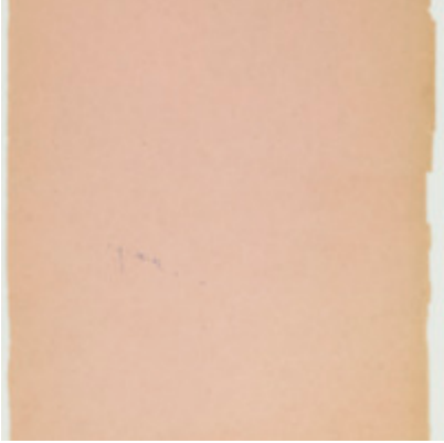
Feuillet 82 (vierge) Foucault, Michel

en la vie, l'âme, le cœur, sans intention, il faut se rendre compte de l'âme, de l'humain, de la conscience. On ne voit qu'il y a une manifestation de la conscience, de l'âme, de la nature de la conscience, il ne faut pas se rendre compte de la conscience, et la conscience est la conscience de l'âme, de la conscience, et la conscience est la conscience. Ainsi, la conscience est la conscience de la conscience, et la conscience est la conscience de la conscience.