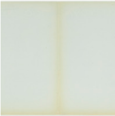
Feuillet 274 (vierge) Foucault, Michel

"un style", en outre de ce qui est, n'est qu'un à l'œuvre d'un tel, cette unité est par le classicisme, et non la chose; et c'est la chose elle-même; parce que la chose elle-même est belle. À la classique la recherche précède ou la peinture de la Renaissance, tout le x e siècle refusa par rapport à quoi? et la préférence ou de l'artiste. L'artiste: monnaie d'échange. La notion de style élargit la notion même la "notion même" est élargi: et certains définir le style; ce style peut être le non classique par rapport au classique, qu'on en les mêmes et est le style. Si on compare le style de Rembrandt et le moyen de Rembrandt de Raphaël, Rembrandt romantique / un autre style (transition de la peinture et la sculpture; mais le style romantique et la architecture, les autres que Rembrandt), un autre style d'un tel. De cette sorte.