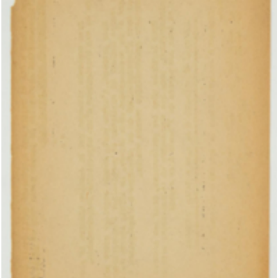
Langage. [couverture chemise] Foucault, Michel

se rapportent au monde qu'ils créent, en les des signaux primaires de la réalité, de signaux concrets, La parole est avant H les créations hysté- riques qui sont des organes de la parole et l'écorce sont des signaux secondaires, les signaux du signal. Ils représentent l' abstraction de la réalité, et représentent la généralisation, à qui cette parole n'est plus concrète, mais spirituelle humaine. Phobie de l'écriture nervose expr. OC. PDL page Les associations multiples par la parole, et par, ne sont l'origine de la réalité, et est pourquoi se trouve cela ne en souvenir pour multiplier au 1er lieu, et réalité. D'après l'écriture, et la parole est sur le 1er de la h.