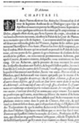
Mythologie, Paris, 1627 - III, 02 : D'Acheron Conti, Natale