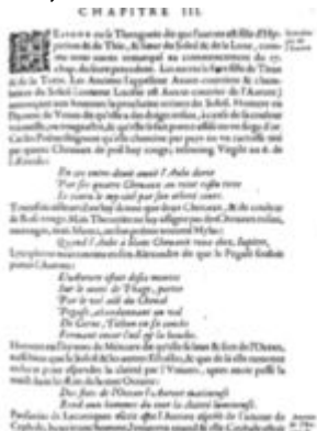
Mythologie, Paris, 1627 - VI, 03 : De l'Aurore Conti, Natale