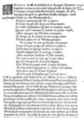
Mythologie, Paris, 1627 - VI, 02 : De Phaëton Conti, Natale