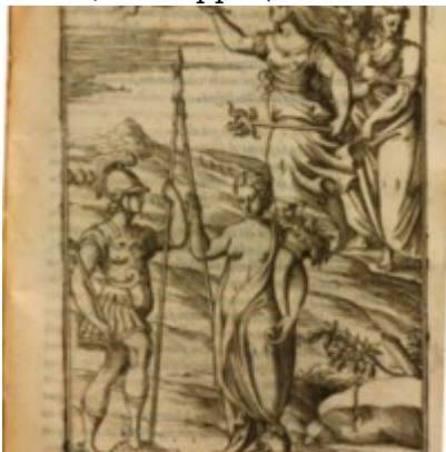
Imagini, Venise, 1571 - 59 : L'Honneur et la Vertu ; Bellone et deux de ses prêtres