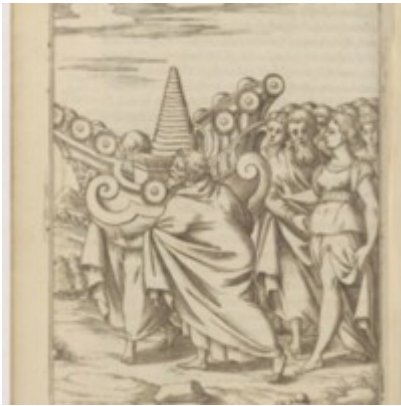
Imagini, Venise, 1571 - 23 : L'oracle de Jupiter Ammon (simulacrum)

Les 3 premiers documents de la collection :