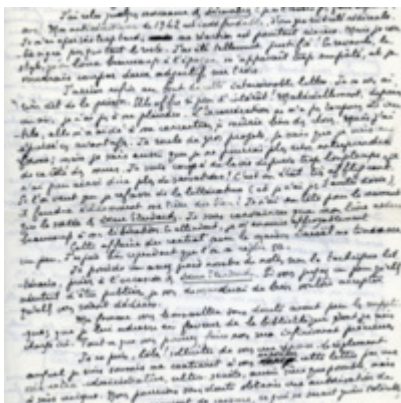
Lettre de Lucien Rebatet à Jean Paulhan, 1951-03-22

Les 10 premiers documents de la collection :