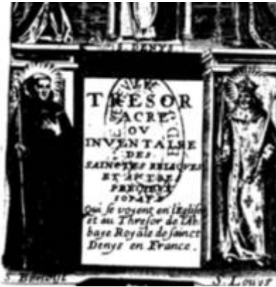
1646 - Jean Billaine - Trésor sacré ou inventaire des saintes reliques - BM Lyon