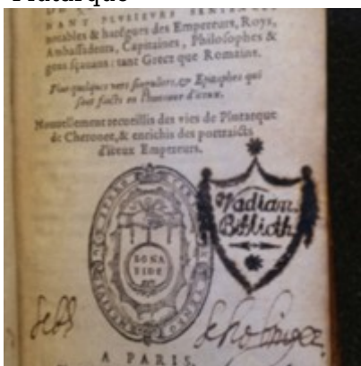
1577 - Claude Micard - Trésor des vies de Plutarque - Saint-Gallen Plutarque