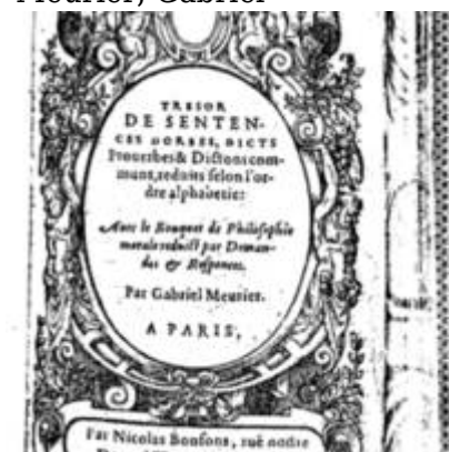
1582 - Nicolas Bonfons - Trésor des sentences dorées - BM Lyon