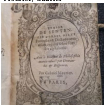
1582 - Nicolas Bonfons - Trésor de sentences dorées - Lucerne