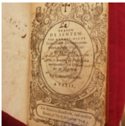
1582 - Nicolas Bonfons - Trésor de sentences dorées - Bibliothèque Sainte-Geneviève