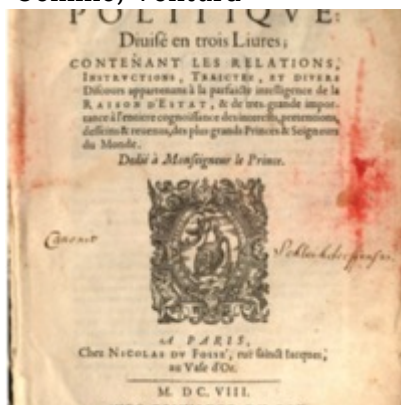
1608 - Nicolas Du Fossé - Trésor politique - BSB Munich Comino, Ventura