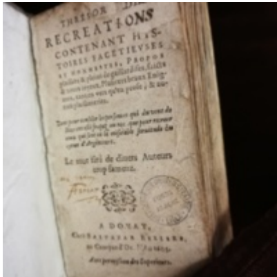
1605 - Balthazar Bellère - Trésor des récréations - BU Lille