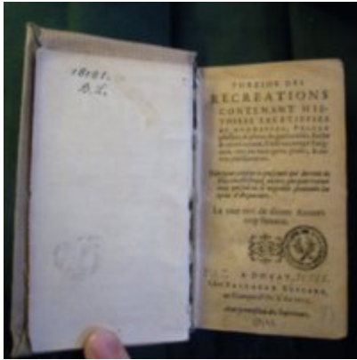
1605 - Balthazar Bellère - Trésor des récréations - BnF