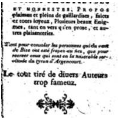
1611 - Raphaël du Petit Val - Trésor des récréations - Anvers Musée Plantin-Moretus