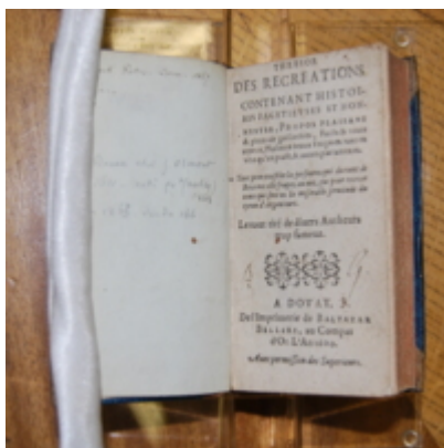
1600 - Balthazar Bellère - Trésor des récréations - Douai Quincy Recueil collectif

Les 10 premiers documents de la collection :