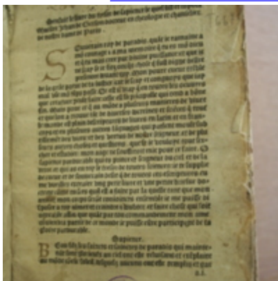
1482c. - Antoine Caillaut - Trésor de sapience - BM Bordeaux [Gerson, Jean] - fausse attribution

Mots-clés : textes doctrinaux et pratiques de dévotion , Trésor médiéval