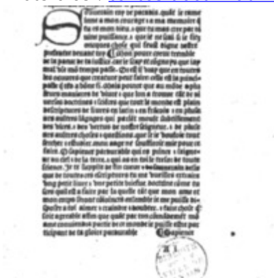
1485c. - Antoine Caillaut - Trésor de sapience - BM Lyon

Mots-clés : textes doctrinaux et pratiques de dévotion , Trésor médiéval