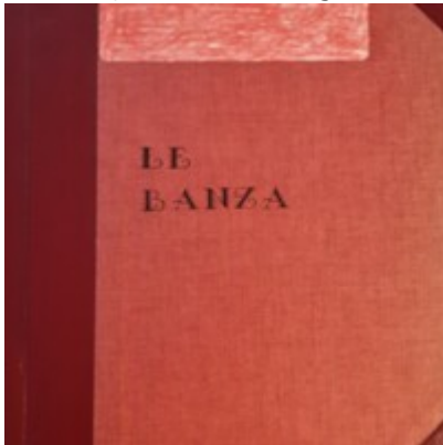
Le Banza [Tps]