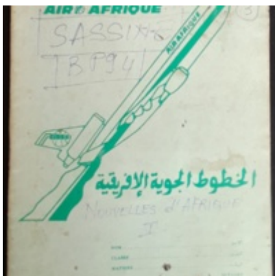
Cahier Nouvelles d'Afrique