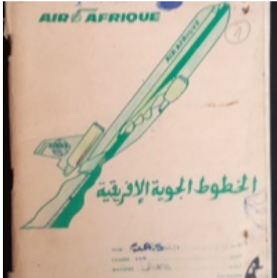
Cahier "Révélation sans sommations", numéroté par Sassine de 1 à 93