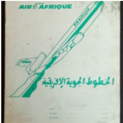
Cahier Le Zéhéros