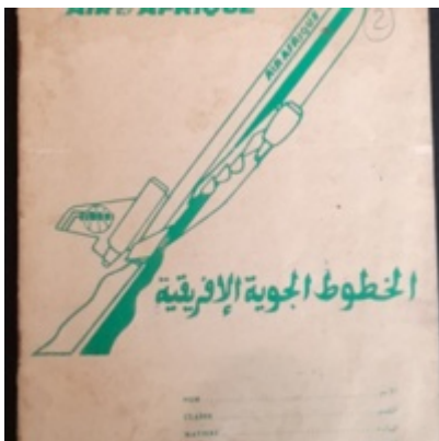
Cahier Mémoire d'une peau, numéroté par Sassine de A à P