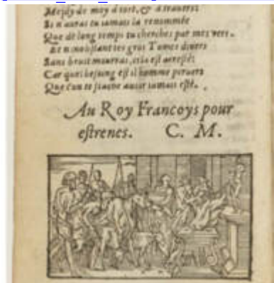
[1554_Par_Gort] 005 Tant que voudras : jette feu, et fumée