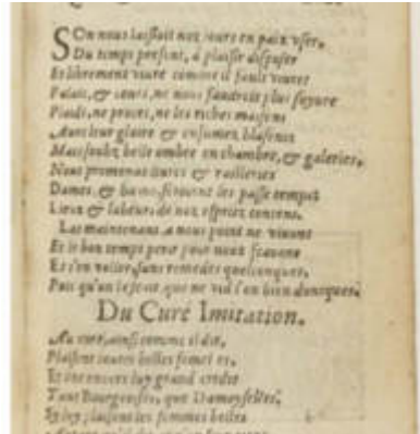
[1554_Par_Gort] 003 S'on nous lassoit noz jours en paix user