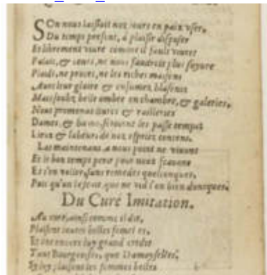
[1554_Par_Gort] 004 Au Curé, ainsi comme il dit