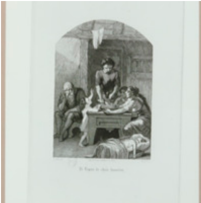
[Titre non renseigné] Foucault, Michel