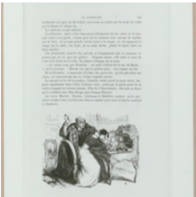
[Titre non renseigné] Foucault, Michel