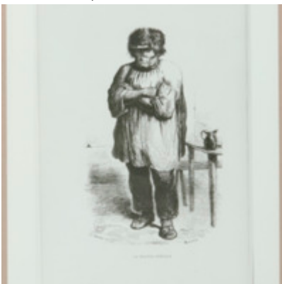
[Titre non renseigné] Foucault, Michel