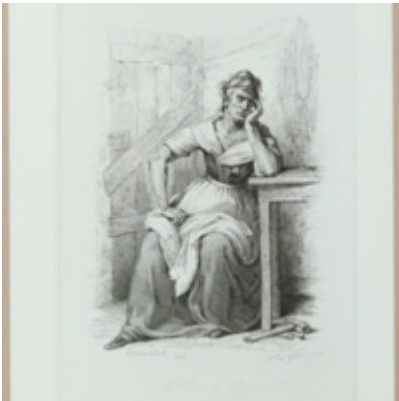
[Titre non renseigné] Foucault, Michel