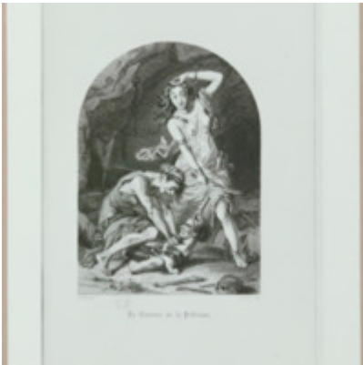
[Titre non renseigné] Foucault, Michel