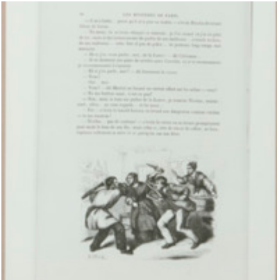
[Titre non renseigné] Foucault, Michel