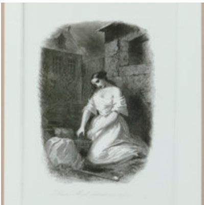
[Titre non renseigné] Foucault, Michel