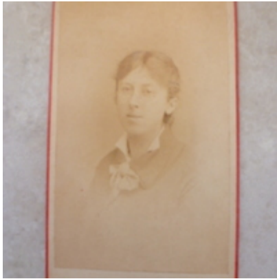
Vernon Lee - portrait photographique 3 - Août 1880