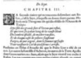
Mythologie, Paris, 1627 - III, 03 : De Styx Conti, Natale

une compagnie de bons esprits, ce sont les justes. Et de tous ces bons esprits, il y en a de deux sortes, les uns qui sont de la nature de la raison, et les autres de la nature de la sensibilité. Les uns sont de la nature de la raison, et les autres de la nature de la sensibilité. Les uns sont de la nature de la raison, et les autres de la nature de la sensibilité. Les uns sont de la nature de la raison, et les autres de la nature de la sensibilité.