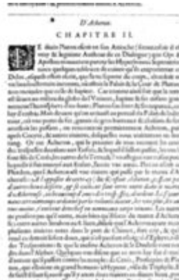
Mythologie, Paris, 1627 - III, 02 : D'Acheron Conti, Natale

une compagnie de bons esprits, ce sont les justes. Et de tous ces bons esprits, il y en a de deux sortes, les uns qui sont de la nature de la raison, et les autres de la nature de la sensibilité. Les uns sont de la nature de la raison, et les autres de la nature de la sensibilité. Les uns sont de la nature de la raison, et les autres de la nature de la sensibilité. Les uns sont de la nature de la raison, et les autres de la nature de la sensibilité.