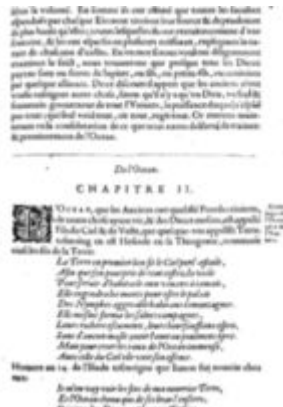
Mythologie, Paris, 1627 - VIII, 02 : De L'Ocean Conti, Natale