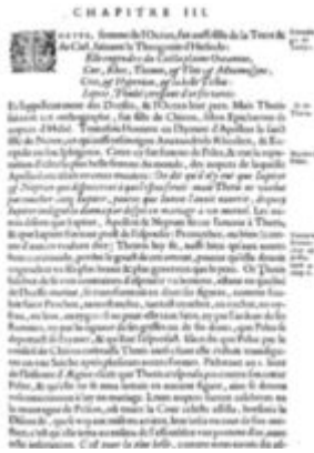
Mythologie, Paris, 1627 - VIII, 03 : De Tethys & Thetis Conti, Natale