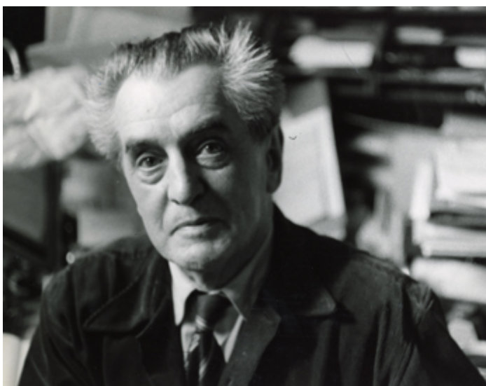
Lettre d'André Dhôtel à Jean Paulhan, 1950

Les 10 premiers documents de la collection :