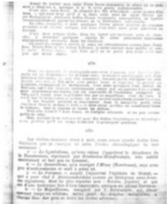
Poésie malgache (La), (Rv3) Rabearivelo, Jean-Joseph