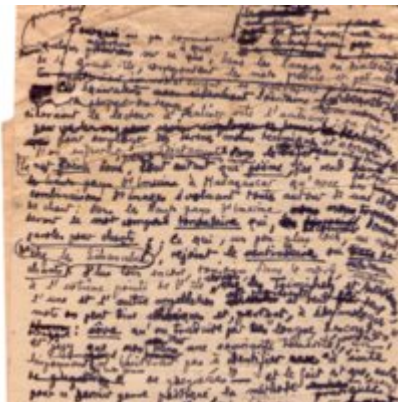
Poésie et folklore malgaches Rabearivelo, Jean-Joseph

Mots-clés : Âme malgache , Francophone , Jean-Joseph Rabearivelo , Manuscrit , Poésie