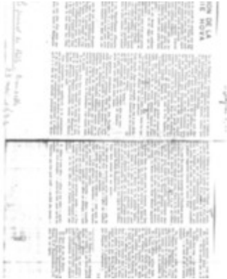
Position de la poésie hova Rabearivelo, Jean-Joseph